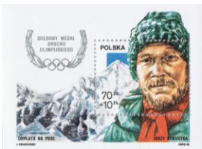
↑ Jerzy Kukuczka na poljski znamki